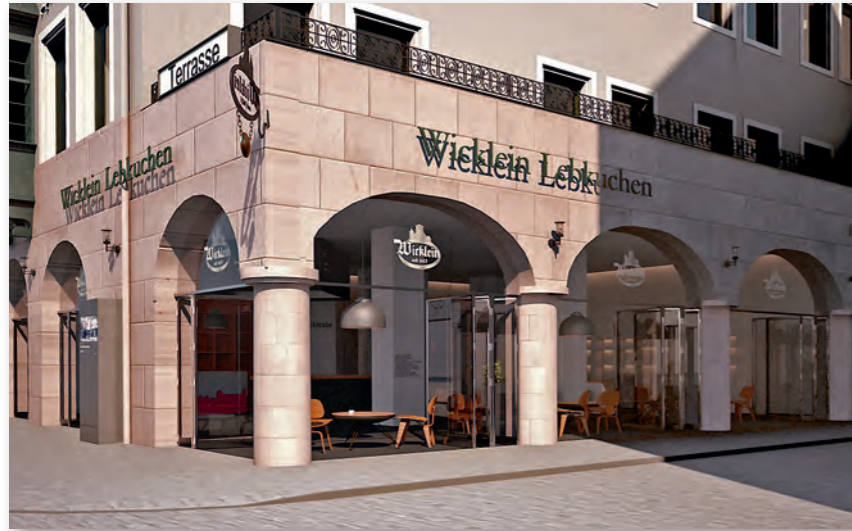
Unser Flagship-Store: „Die Lebkücherei“

Unsere „Lebkücherei“ mit Flagship-Store und Lebkuchen-Café befindet sich im Herzen der Stadt, direkt am Nürnberger Hauptmarkt, auf dem alljährlich auch der weltberühmte Christkindlesmarkt stattfindet. Genießen Sie ofenfrische Lebkuchen und andere Süßspeisen, zahlreiche Kaffee- und Teespezialitäten oder erfrischende Drinks mit Blick auf Frauenkirche und Schönen Brunnen.